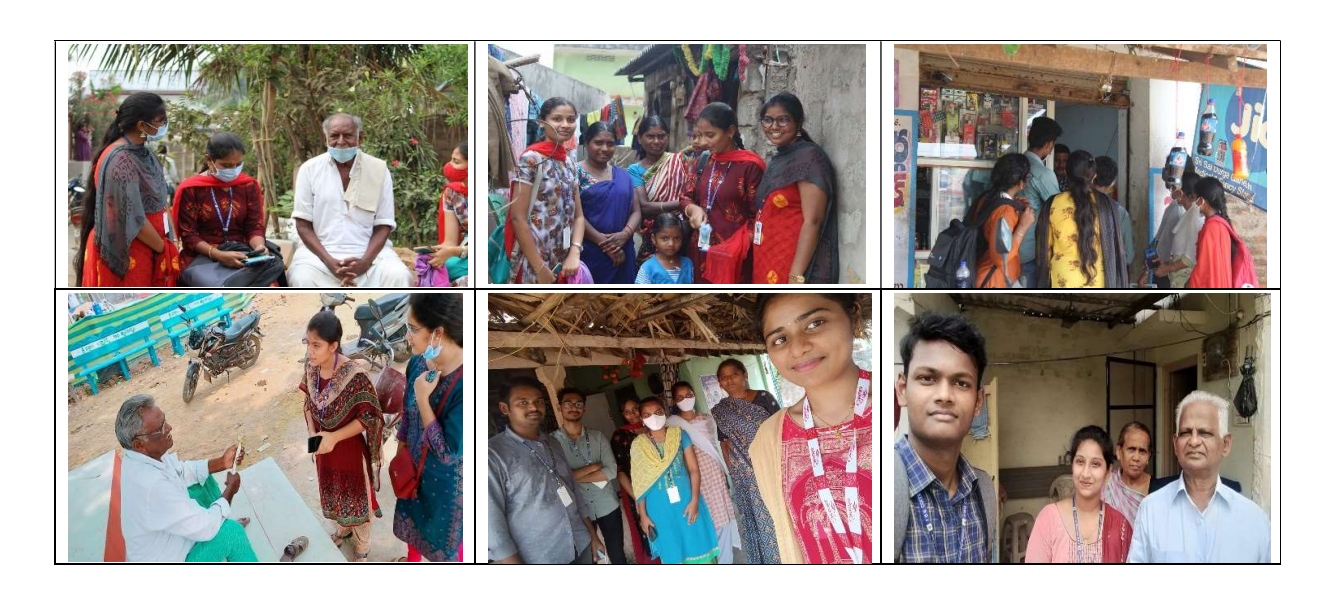
Field Visit and Interviews in Nearby Village Ganapavaram